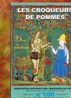
Le bulletin national

La Vaucharde : pomme vosgienne Utilisation : couteau, jus Consommation : déc. à mars