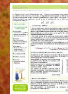
Le Lierre bulletin local